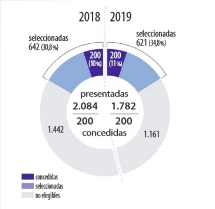
Ayudas para contratos Ramón y Cajal. 2018 y 2019